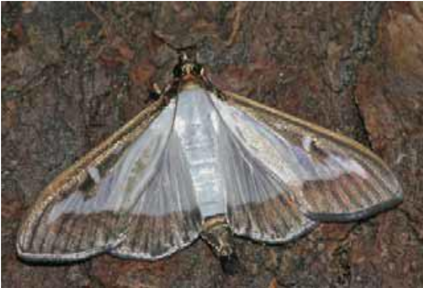
Stadtgärtnerei Basel, H. Becherer